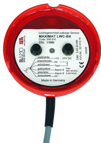
Undersiden af føleren