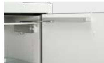
Türschließmechanismus mit Türfeststellung

Die Serie PROline erfüllt die aktuelle Norm DIN EN 14470-1. Sie ist damit noch praxistauglicher und sicherer. Beim Brandkammertest im akkreditierten Prüfinstitut hat dieser Sicherheitsschrank mit über 107 Minuten am Markt die wahrscheinlich höchste Feuerwider-