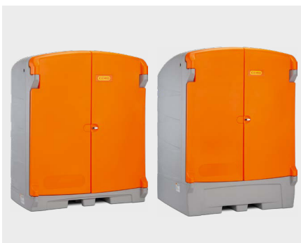
PE IBC miljødepot 220/2 og 1100/1