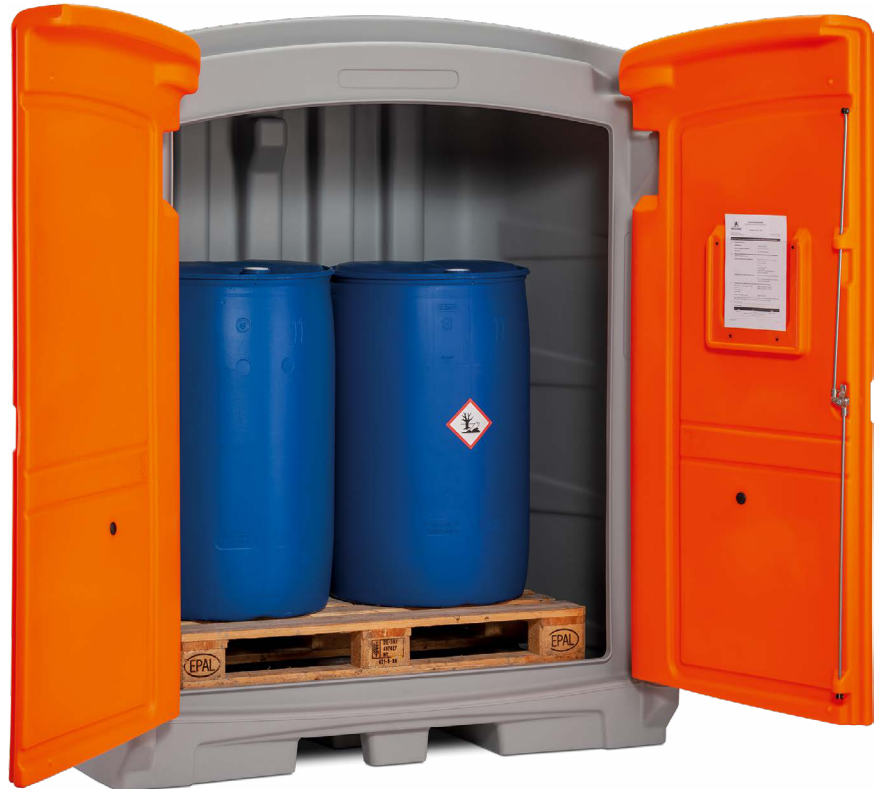
PE IBC miljødepot 220/2 med europalle og 2 tromler