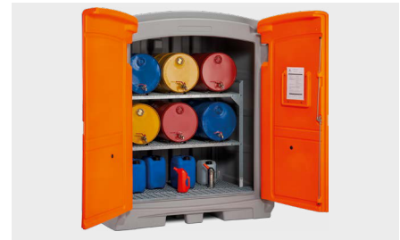
PE IBC miljødepot 220/2 med tromlereol type 360, stålitter som 3. lagerniveau og stålitterrist som påfyldningsområde