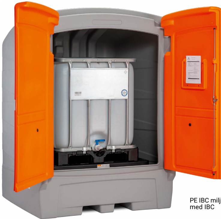
PE IBC miljødepot 1100/1 med IBC