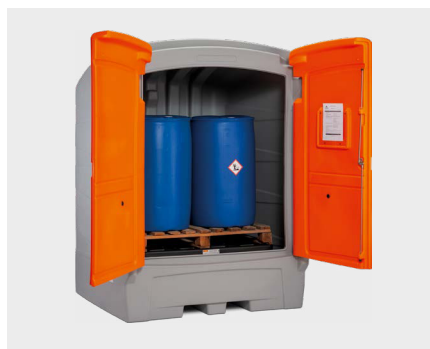
PE IBC miljødepot 1100/1 med industri-palle og 4 tromler